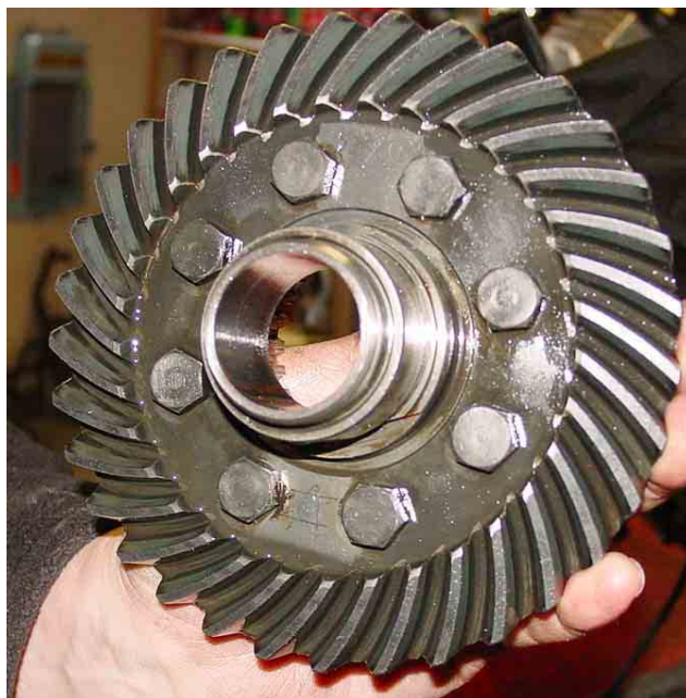
Le couple conique