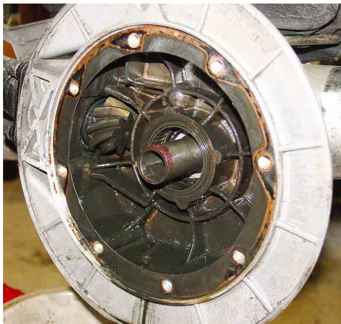
Le carter du pont