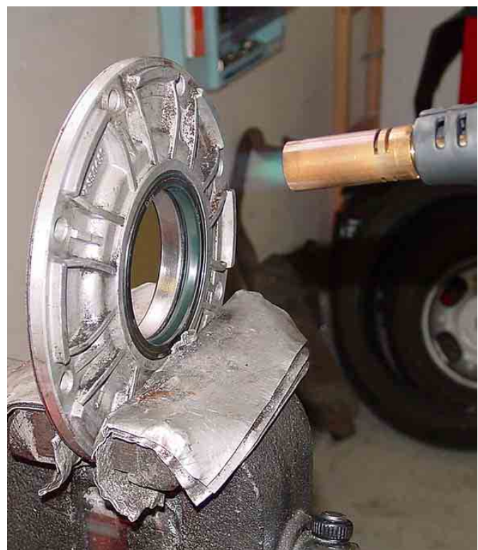
Pour ôter le spi, nous l'avons légèrement chauffé.