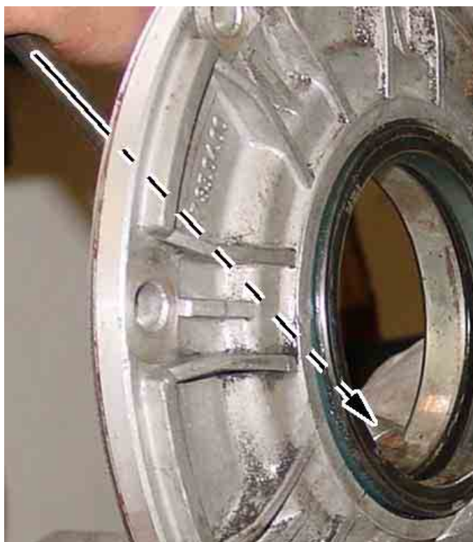
Puis nous l'avons chassé de l'intérieur à l'aide d'un jet.